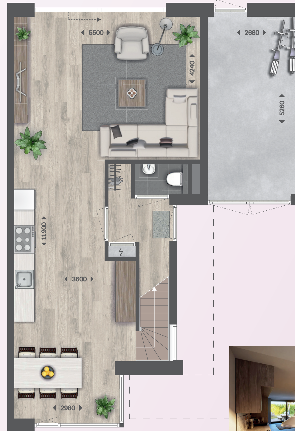
BEGANE GROND, KAVEL 11 EN 13

De twee identieke woningen liggen aan Het Doel in een kindvriendelijke en rustige buurt. Het centrum van Hilvarenbeek is op loopafstand, net als de supermarkt. De woningen hebben 3 slaapkamers op de eerste verdieping met de mogelijkheid voor een extra slaapkamer op de tweede verdieping.