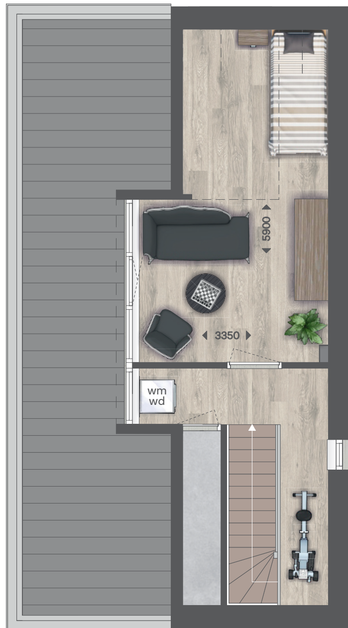
TWEDE VERDIEPING, KAVEL 11 EN 13