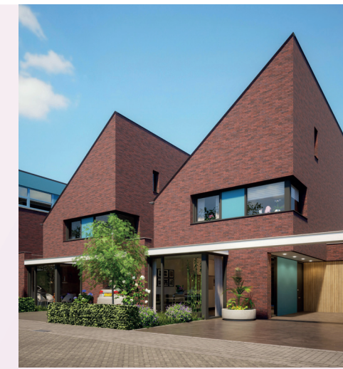
EXTERIEUR IMPRESSIE KAVELS 11 EN 13