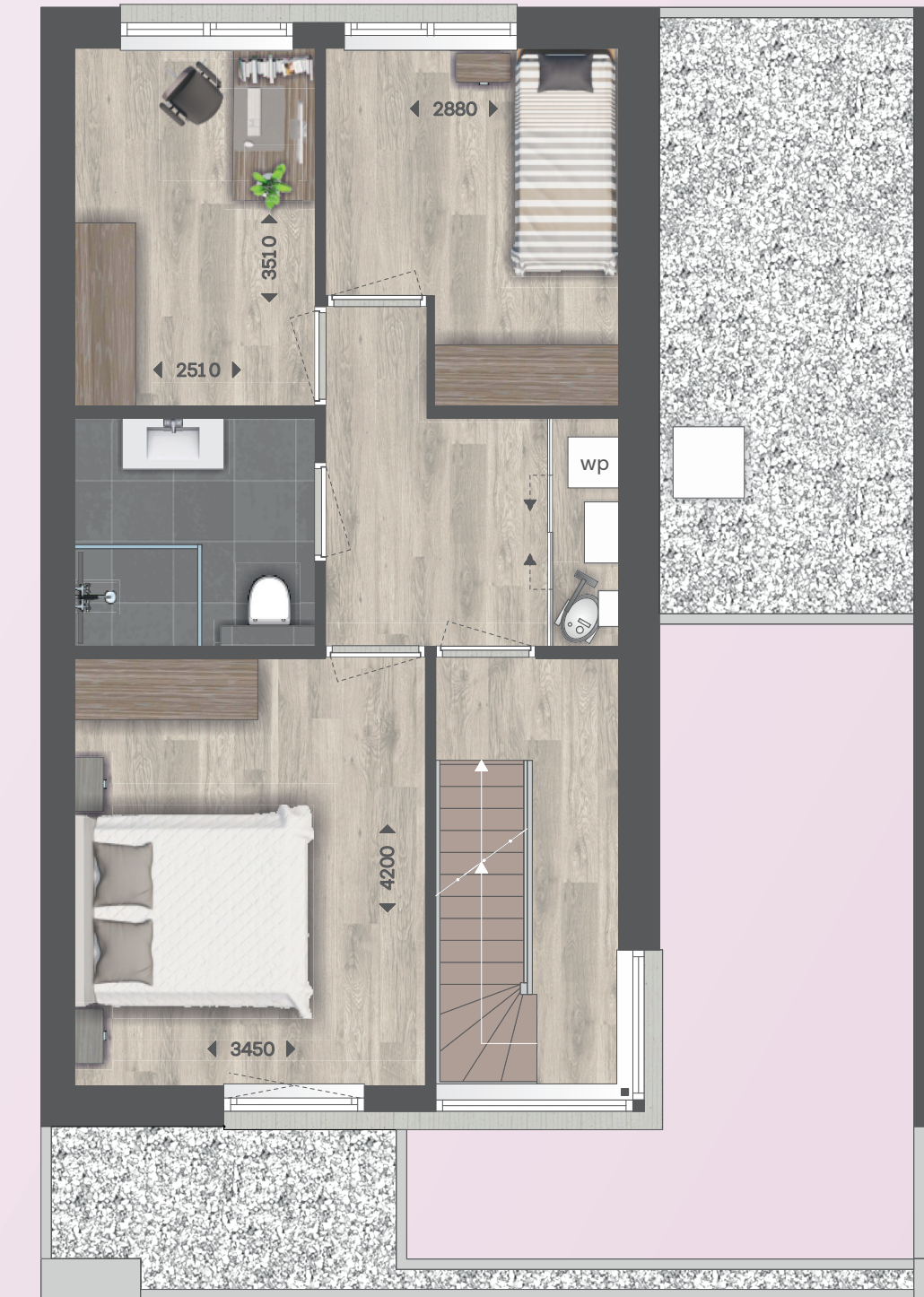
EERSTE VERDIEPING, KAVEL 11 EN 13